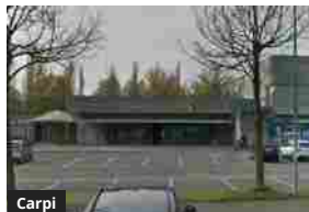
Carpi, orario prolungato per la biglietteria Seta dell'autostazione