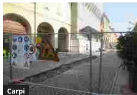
Carpi, prosegue il cantiere in corso Fanti